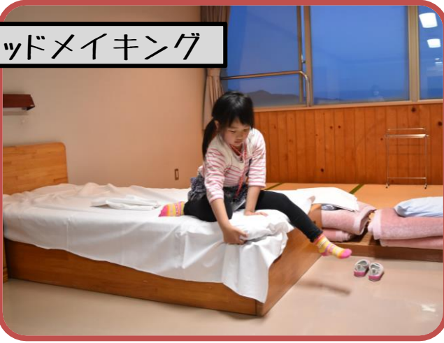
ベッドメイキング