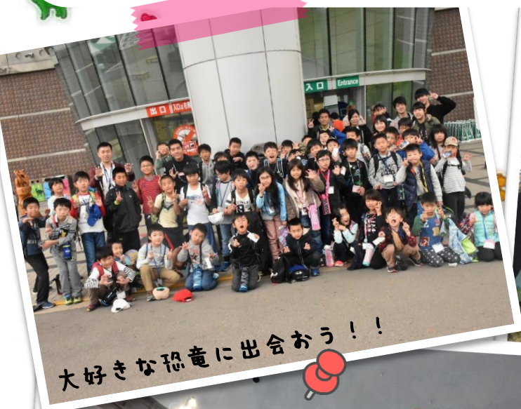
大好きな恐竜に出会おう!!