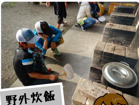
野外炊飯 火おこし