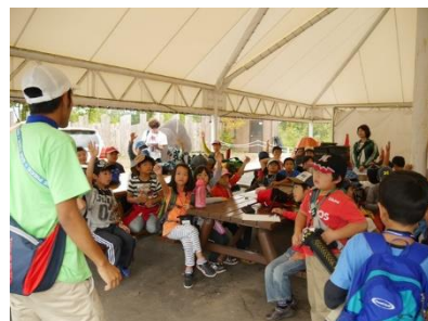
まんまる会議の様子→

ふくい夏のさとやまキャンプでは子どもたちが主役のキャンプ作り（恐竜コース一部のプログラムを除いて）細かい日程プログラムは決めていません。一日目に「まんまる会議」を開きみんなのやりたいことを聞いた後、各日程に反映させていきます。