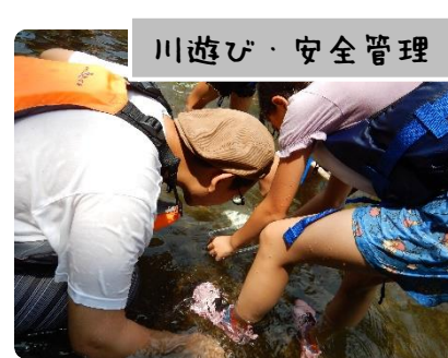
川遊び・安全管理