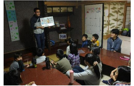
まんまる会議の様子→

さとやまキャンプでは子どもたちが主役のキャンプを創りたいため細かい日程プログラムは決めていません。一日目に「まんまる会議」を開きみんなのやりたいことを聞いた後、各日程に反映させていきます。