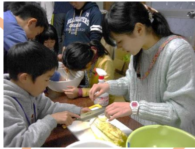
↑ごはん作りの様子 包丁などで怪我しないように見守ります。